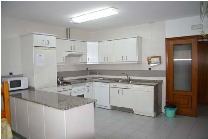
Cocina y comedor