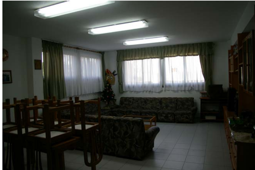
Sala de estar y despacho educativo